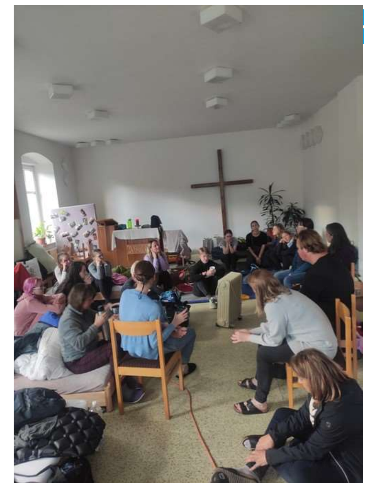
Helpers need help